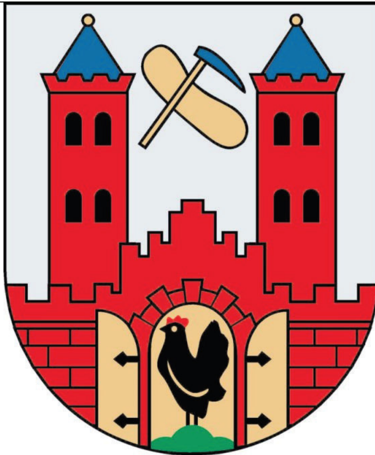
Anlage 2: Stadtsiegel der Stadt Suhl zu § 1